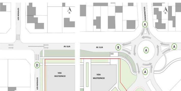
Niveles de Servicio de la rotonda de ingreso